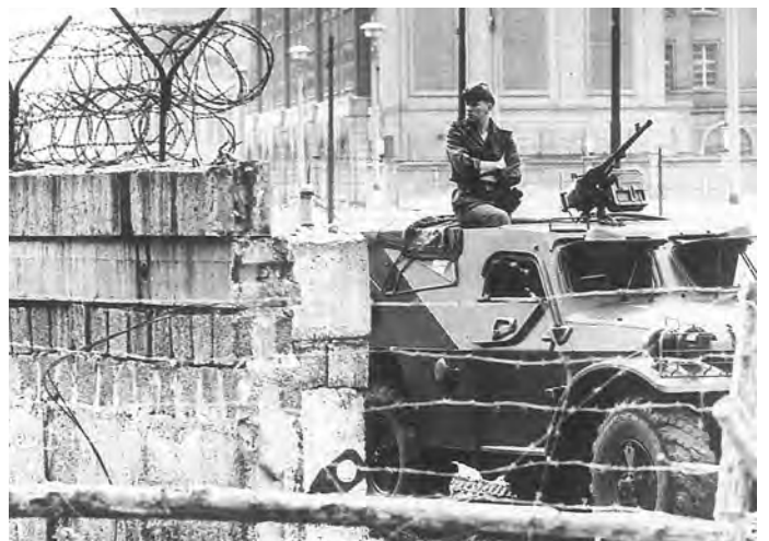
28 Jahre war Berlin durch die Schandmauer geteilt

Konnte man aber angesichts all dieser Ereignisse überhaupt noch auf eine Wiedervereinigung hoffen?