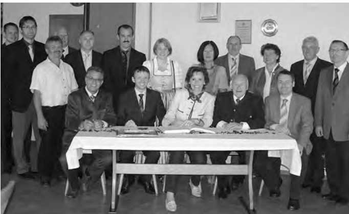
Fr. Christine Haderthauer, Staatsministerin beim Eintrag in das goldene Buch der Gemeinde Rattiszell

Am Samstag fand ein Standkonzert am Dorfanger und der Einzug der Vereine in die Festhalle statt. Ab 19 Uhr war ein bayerischer Unterhaltungsabend mit den „Ottis“. Der Sonntag begann mit dem traditionellen Stand- und Trödelmarkt. Als einen weiteren Höhepunkt reihte sich die „Verpflichtung“ der Staatsministerin Frau Christine Haderthauer für einen politischen Frühschoppen in die Festgeschichte des Sportvereins ein. Nach dem Eintrag ins Goldene Buch der Gemeinde konnten der Ehrengast sowie die zahlreichen Regionalpolitiker mit den Abordnungen der Ortsvereine von der „Haibacher Musiblos'n“ „in's Zelt gespielt“ werden. Nach den interessanten Ausführungen zur Landes- und Bundespolitik von Frau Haderthauer vertiefte im Anschluss MdB Ernst Hinsken als Schlussredner noch das eine oder andere Thema. Mit einem Musikantentreffen und der Abendunterhaltung mit der „Haibacher Musiblos'n“ klang der 32. Bergmarkt am Sonntagabend aus.