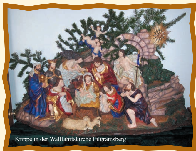
Krippe in der Wallfahrtskirche Pilgramsberg