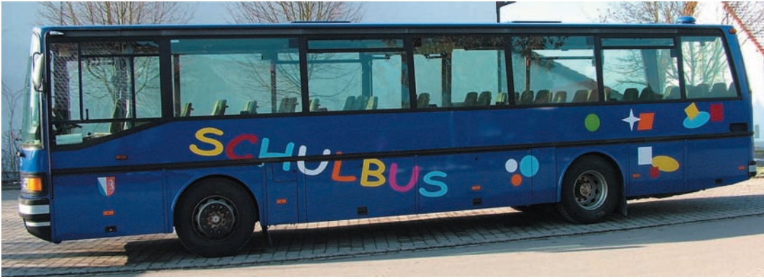
Der nach dem Kinderwunsch gestaltete Schulbus