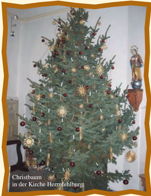
Christbaum in der Kirche Herrnfelburg