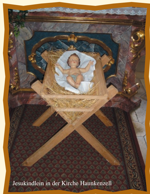
Jesukindlein in der Kirche Haunkenzell