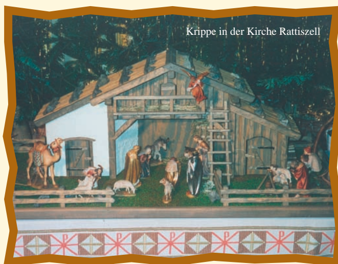
Krippe in der Kirche Rattiszell