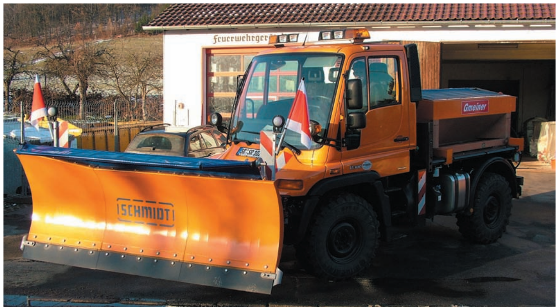
Der neue Unimog - gut gerüstet für den Winterdienst